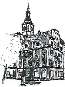
Rynek Wieża ratuszowa