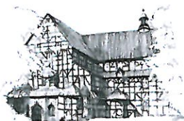
Kościół Pokoju pw. Św. Trójcy Wpisany na listę UNESCO