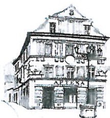
Kamienica „Pod Bykami”